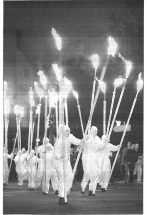
Feuer und Flamme für Folkwang: Das Theater Total entfachte eine feierlich-schauriges Spektakel am RWE-Turm. Dabei legten sich Nebelschwaden über das Wasserbassin vor dem hell erleuchteten Hochhaus.