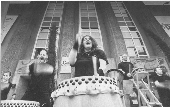
Trommeln in der Folkwang-Nacht ließen am Grillo-Theater den Beton beben. Auch ansonsten gab es viel Musik: von romantischen Orgelwerken bis zu zeitgenössischen Klängen.